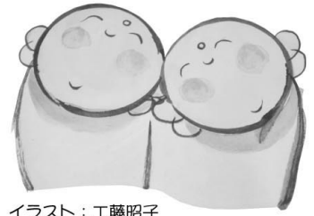
イラスト：工藤昭子