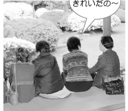
和合大学院① 鶴岡市旧風間家別宅庭園にて

四学区内65歳以上対象 “たくさん笑って、 いつまでもお元 気に!”のキャッチフ レーズに集った5期 生となる27人の学院生。 今年度も賑やかにス タートをきった。