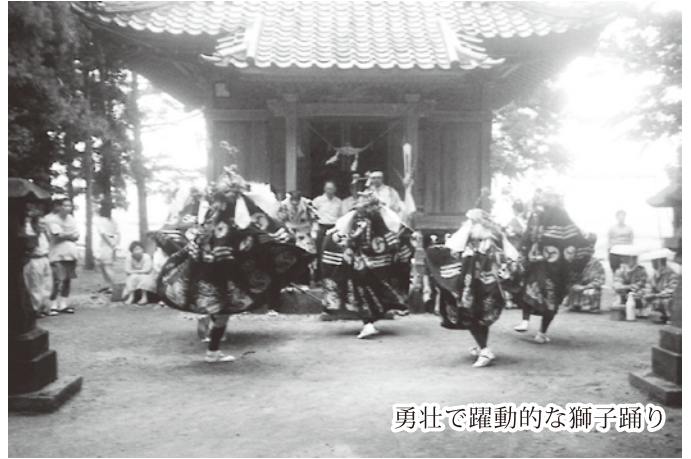
勇壮で躍動的な獅子踊り

獅子共が踊り終わると、獅子神様のお札をいただき、冷たい物やスイカなどで労をねぎらいます。獅子らは、次の村へ太鼓を打ち鳴らしながら出発するのです。