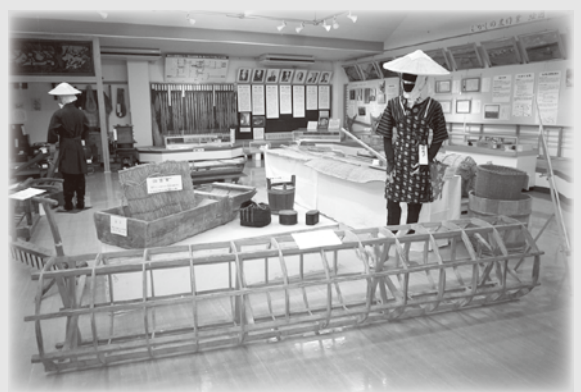
田植え・除草の展示