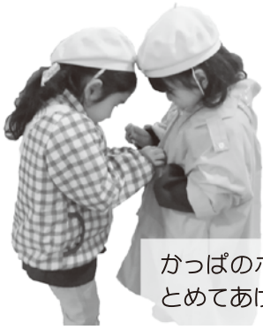
かっぱのボタン、 とめてあげるね。